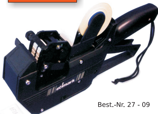
Best.-Nr. 27 - 09