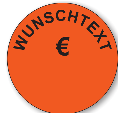
Bestell-Nr. 50 - 06