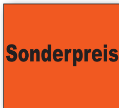
Best.-Nr. 27 - 05