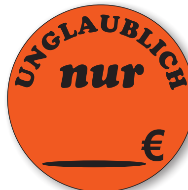
Bestell-Nr. 50 - 05