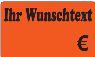
Bestell-Nr. 30 - 07

500 Stück auf der Rolle KEINE Satz- oder Klischeekosten