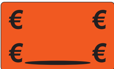
Bestell-Nr. 30 - 05