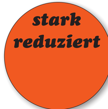
Bestell-Nr. 50 - 03