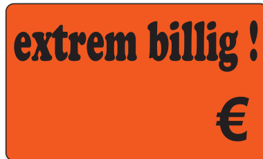
Bestell-Nr. 30 - 02