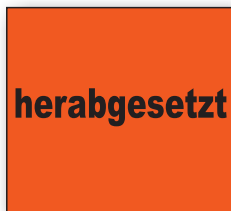
Best.-Nr. 27 - 06