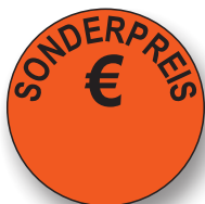
Best.-Nr. 24 - 01