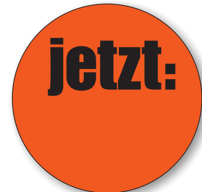
Bestell-Nr. 50 - 04