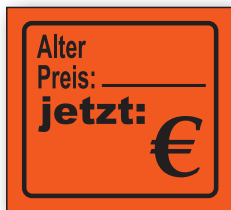
Best.-Nr. 27 - 02