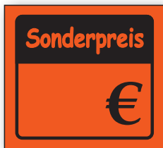
Best.-Nr. 27 - 03