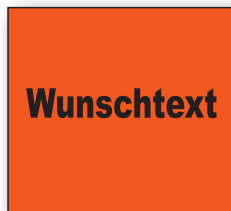
Best.-Nr. 27 - 08