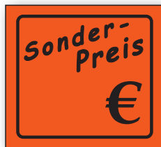
Best.-Nr. 27 - 04