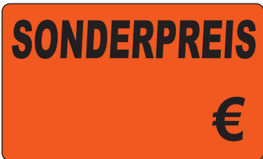
Bestell-Nr. 30 - 01