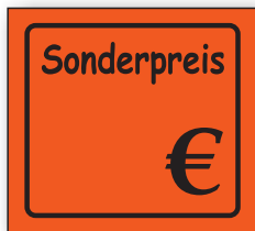
Best.-Nr. 27 - 01