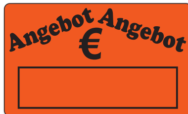
Bestell-Nr. 30 - 06