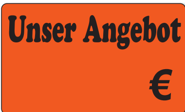
Bestell-Nr. 30 - 03