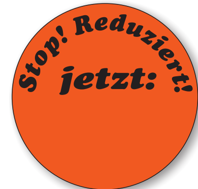
Bestell-Nr. 50 - 02