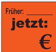
Best.-Nr. 27 - 07