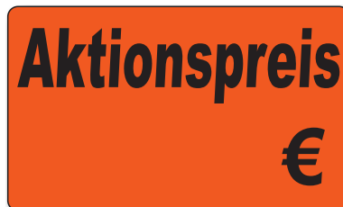
Bestell-Nr. 30 - 04