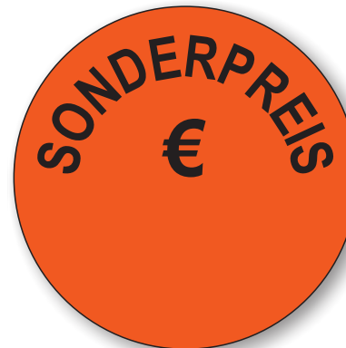
Bestell-Nr. 50 - 01

500 Stück auf der Rolle KEINE Satz- oder Klischeekosten